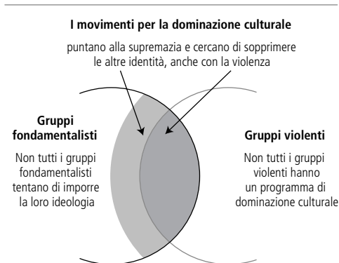
Figura 4.1 I movimenti per la dominazione culturale non coincidono con tutti i movimenti fondamentalisti o tutti i movimenti violenti