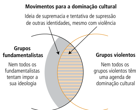
Figura 4.1 Movimentos para a dominação cultural – diferente de todos os movimentos fundamentalistas ou violentos