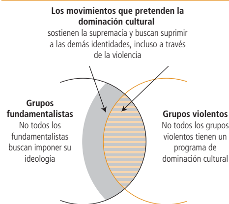
Figura 4.1 Movimientos que pretenden la dominación cultural – no son iguales a todos los movimientos fundamentalistas o a todos los movimientos violentos